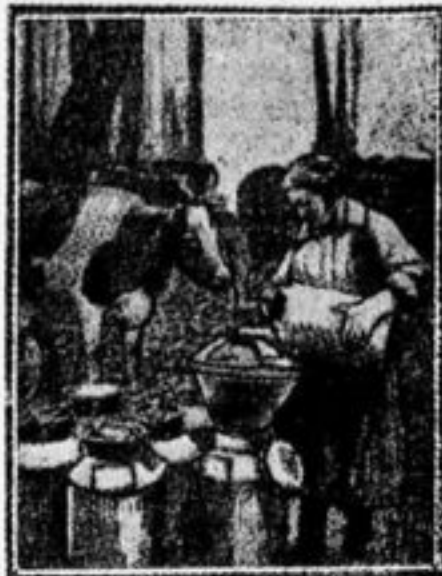
Колхозница сливает молоко.

— В нашей деревне многие крестьяне не отдают своих детей в ясли. Тут нужна разъясни-