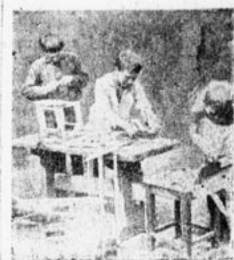
Своими руками можно смастерить изумительные вещи.

В базе Кр. Пресни завода № 1 трудовые навыки помогли наладить дело самообслуживания. Во время выезда в лагери сами ребята отремонтировали 118 кроватей. Летом сами сделали плат для экскурсий и т. д.