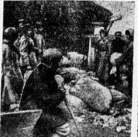
Бойцы ОДВА помогают колхозу убирать урожай.

В № 139 «Пионерская Правда» подняла вопрос о посылке меморандума нанкинскому правительству. Наш форпост, не дожидаясь инструкции и указания со стороны райбюро, провел по школе кампанию по сбору подписей. Подписи дали 100 проц. учащихся. Начата