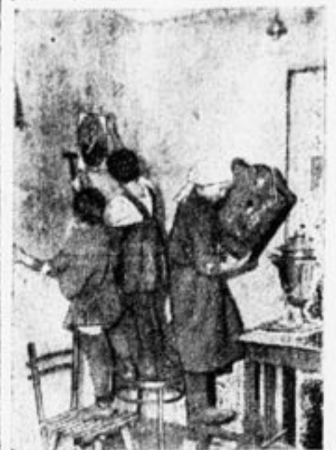
Довольно икона висела на стене! Хватит разводить паутину.

Интересно отметить, что и сами ребята, и руководитель говорят, что девочки гораздо лучше ребят работали в мастерских.