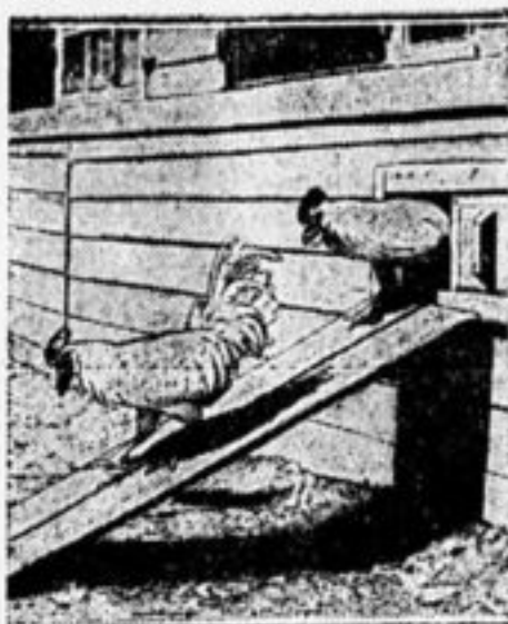
Образцовый птичник в совхозе «Гигант».

Во время горячей работы туда будут уходить работницы с маши-