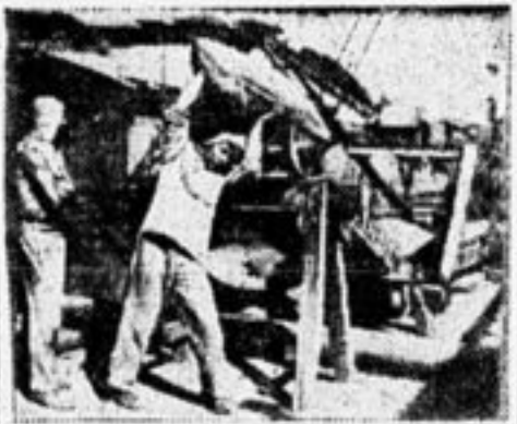
Владивосток. В порту. Грузчики за работой у конвейера.

Териконцы — честные ребята... Они любят труд. Факт: терикон большой. Кети места на териконе.