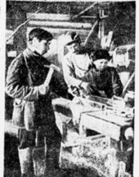
Колония имени 8-го марта. В мастерской.

Мы предлагаем наряду с организацией мастерских создавать кружки изобретателей, привлекая к этому делу взрослых изобретателей-рабочих.