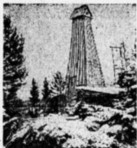
Добыча минеральных удобрений.

Все 6 тысяч гектаров бывших колхозных полей стали полями комбинатскими. Они находятся под единым наблюдением агронома «Коммаяка». Засеваются самым лучшим сортовым зерном пшеницы земли. Обрабатываются