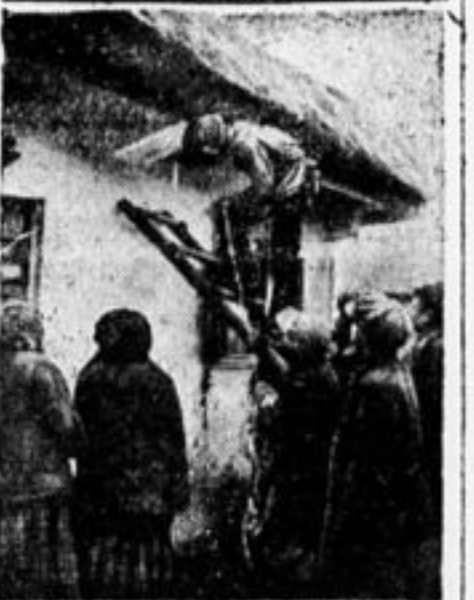
Электрификация украинских сел. Проводка света в крестьянскую избу в селе Знаменке, Зиновьевского округа. Проводку делают школьники.

— Мы поселим к вам в клуб транспортников, и они вас будут атаковать.