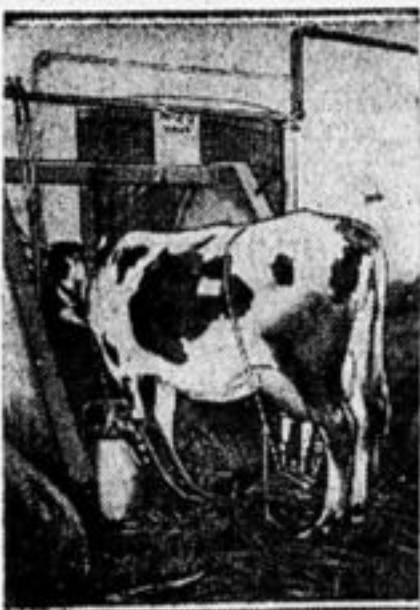
Дойка коров с помощью электричества.

На самом краю комбинатских владений лежит большая артель «Юртмоз». В этой артели за зиму произошла целая революция. Старые члены артели развели за счет общественных средств большие собственные стада коров. Вновь принимаемые артельцы — бескоровная беднота — жили в артели на работы приумножились хлева богатых, работали много. От этой работы приумножились хлева богатых, а в кармане бедняков, как было пусто, так и оставалось... Общественное обслуживание интересов своих членов в артели также было слабое. За артелью